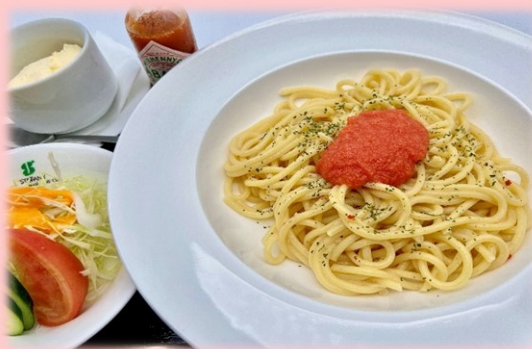
明太子ペペロンチーノ 1,485円