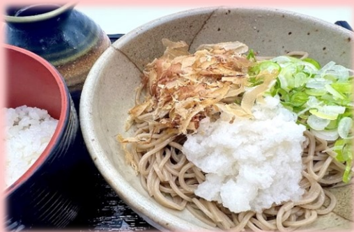
おろし蕎麦セット 1,250円