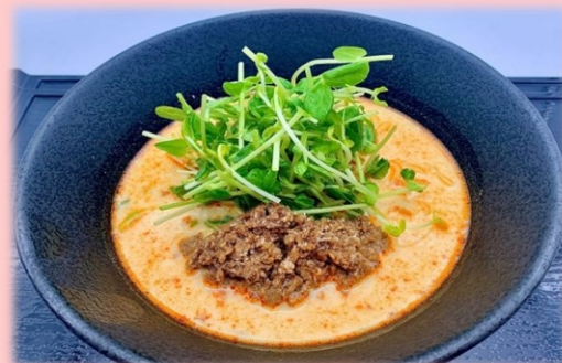
冷やし豆乳担々麺 1,210円